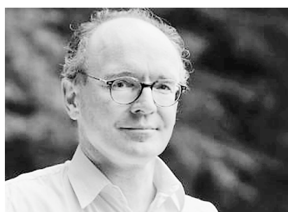
Stilistische Pracht. Der deutsche Schriftsteller Martin Mosebach.

KLANGKULTUR. Auch Sabine Meyer geht es um Klarheit: Als Solistin im eher selten zu hörenden Klarinettenkonzert von Aaron Copland zelebrierte sie im langsamen Teil Klangkultur der höchsten Güte, liess die Schwierigkeit der ausgedehnten Kadenz fast vergessen, ging aber die Jazz-Anklänge des schnelleren zweiten Teils ohne showmässige Übertriebenheit durchaus keck an. Schade, dass aus «technischen Gründen» das zweite Copland-Werk, die «Latin-American Sketches» entfielen, und stattdessen auf eine nun schon etwas abgenutzte alte Nummer, die «Valse triste» von Sibelius, zurückgegriffen wurde.